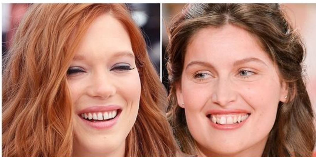
Léa Seydoux e Laetitia Casta

Il sorriso è "l'accessorio più bello che può indossare ogni donna", diceva Audrey Hepburn. E il suo fascino supera ogni canone o imperfezione estetica. La dimostrazione arriva anche da molte donne dello star system: qualcuna, sull'imperfezione, ha costruito un'intera carriera, da Laetitia Casta a Vanessa Paradis , da Madonna alle super modelle Jessica Hart e Georgia May Jagger .